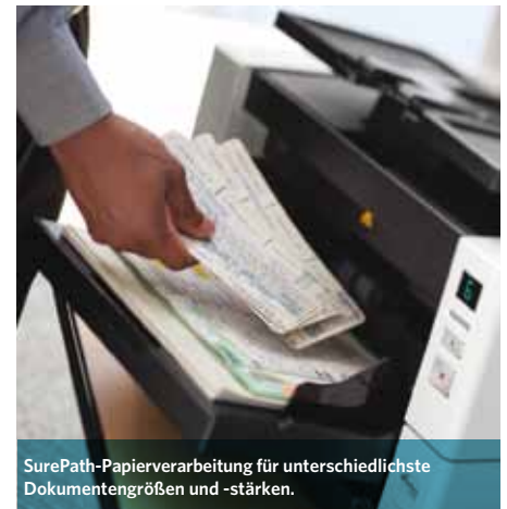
SurePath-Papierverarbeitung für unterschiedlichste Dokumentengrößen und -stärken.

Der kleinste Scanner seiner Kategorie, der eine Einzugskapazität von 500 Blatt bietet.